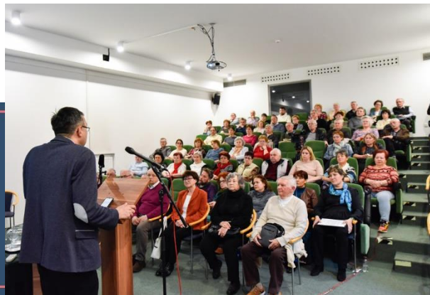
Tudományos-ismeretterjesztő előadás a Marcali Múzeumban