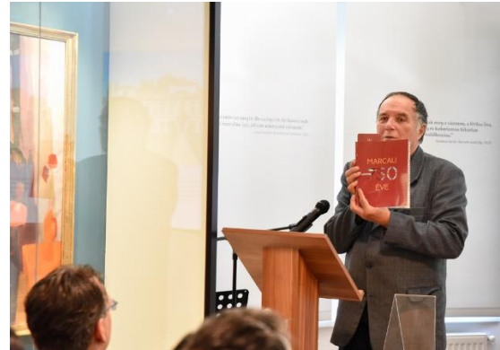
Könyvbemutató: 2024.05.30-án a Bernáth Aurél Galériában