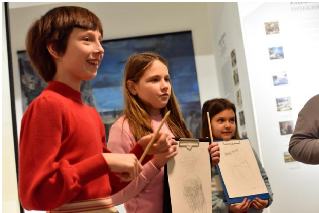
Múzeumpedagógiai programok balról: a betlehemezéshez, jobbról Bernáth Aurél festőművészhez kapcsolódóan