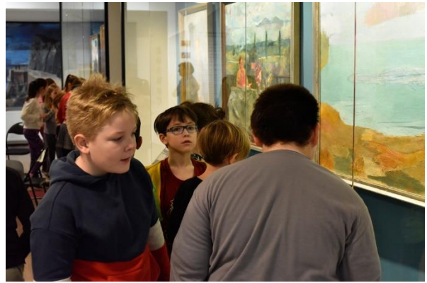
Tárlatvezetés felnőttek és gyermekek számára